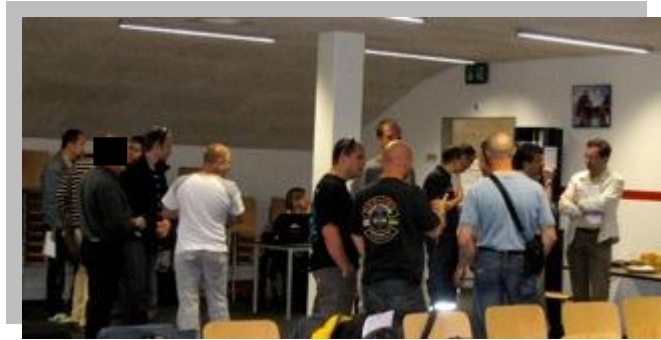
Un bon démarrage de la journée autour d'un café et d'un croissant.

Il n'est plus besoin de présenter la formation CEFOCA aux intervenants pré-hospitaliers car depuis déjà longtemps celle-ci est connue et reconnue.